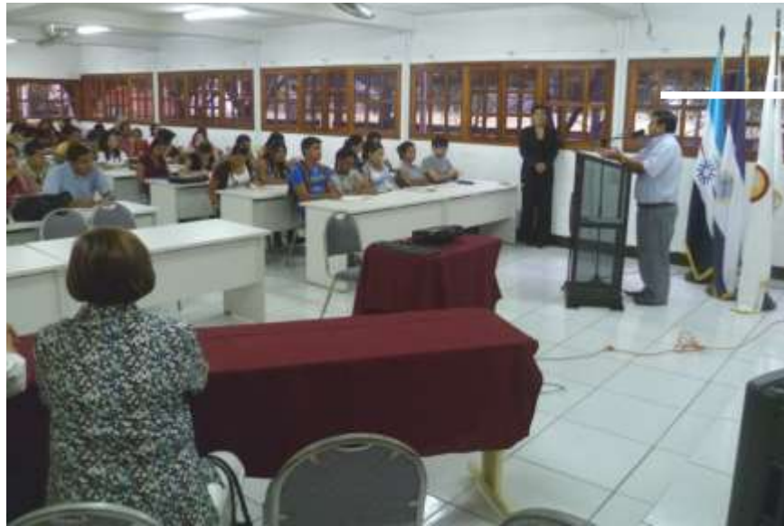
La Universidad de Ciencias Comerciales de León, resultó ser la sede para realizar la primera conferencia sobre nociones general de competencia a inicio de este mes de octubre.