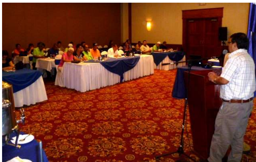
Procompetencia de Nicaragua inauguró el inicio de una jornada de capacitación que se extenderá hacia el próximo año en coordinación con el Instituto Nacional de la Competencia de la Dirección de Políticas de Comercio del MIFIC y el Instituto de defensa del Consumidor INDEC.