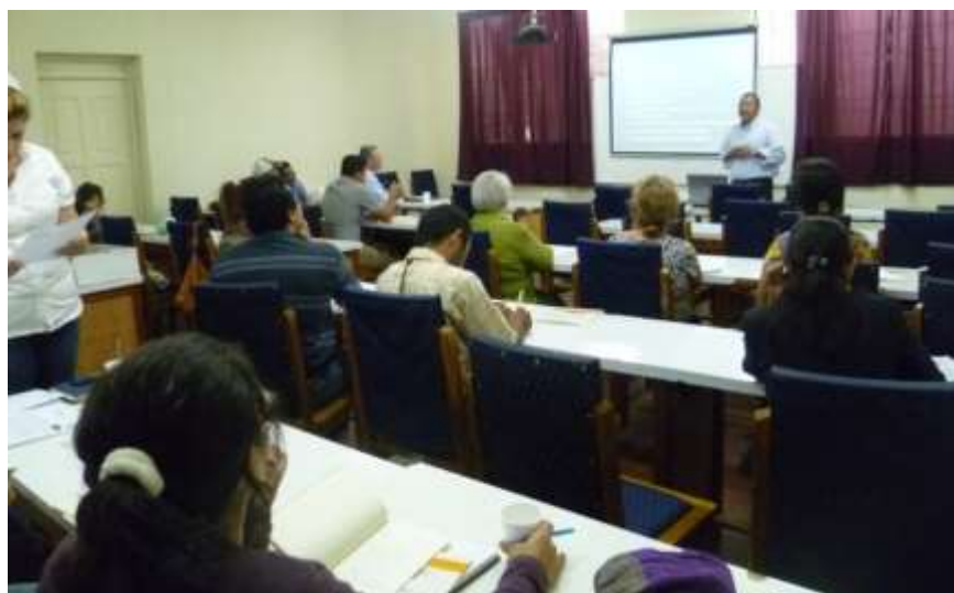
Con el apoyo de autoridades del Ministerio de Economía Familiar Comunitaria y Cooperativa de Matagalpa se llevó a efecto un importante taller de capacitación sobre la Ley 601 y su ámbito de aplicación.