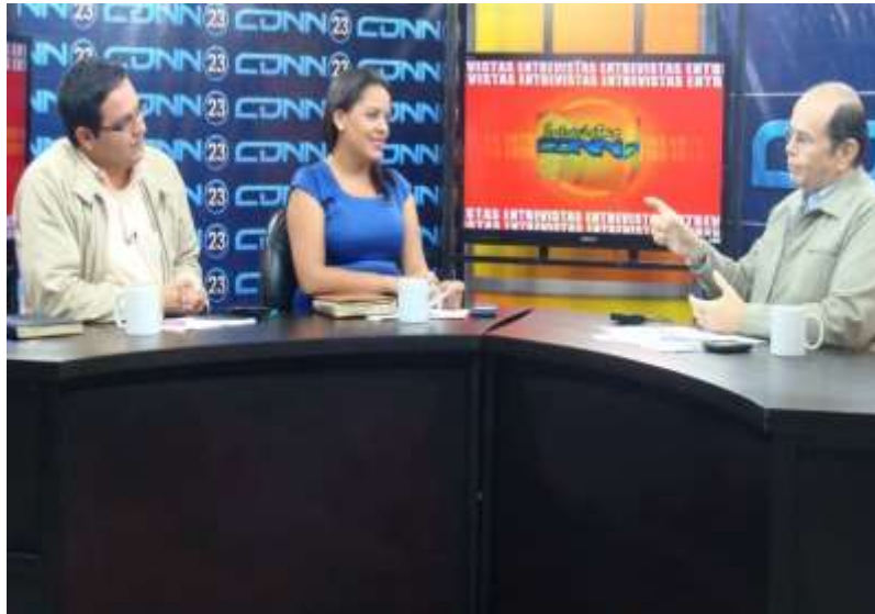
Presentando resultados del impacto de las barreras privadas en perjuicio de las MIPYME de Nicaragua.