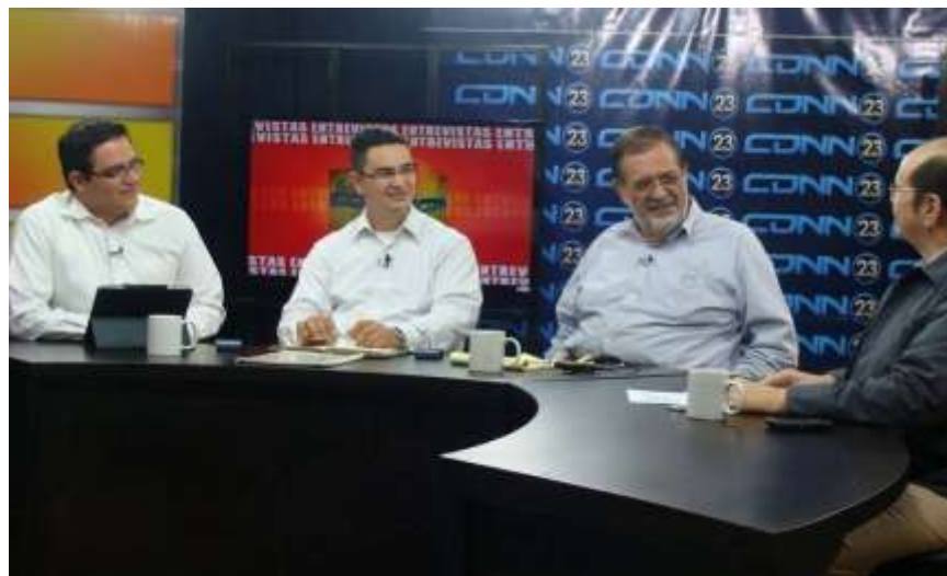
Informando sobre el avance de las tareas cumplidas por Procompetencia.