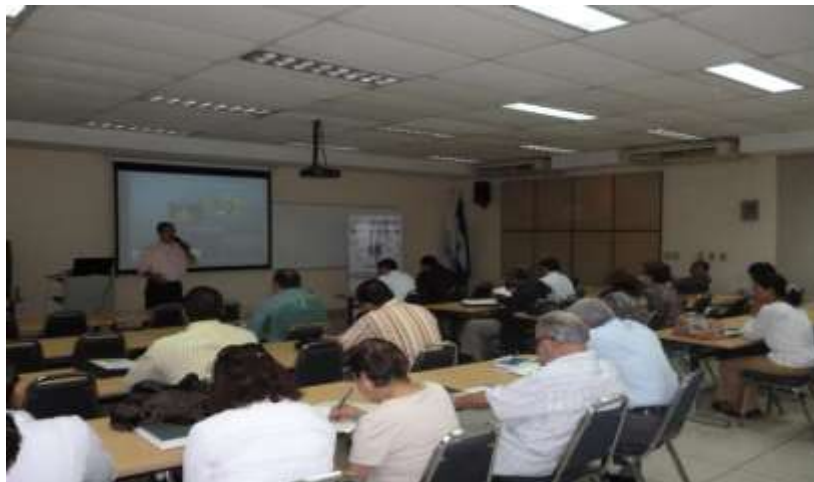
Miembros de la Asociación Nicaragüense de Agentes Profesionales de Seguros (ANAPS) presentes en exposición sobre Aspectos generales de la Ley de Competencia, Ley 601 y sus reformas por funcionarios de Procompetencia.